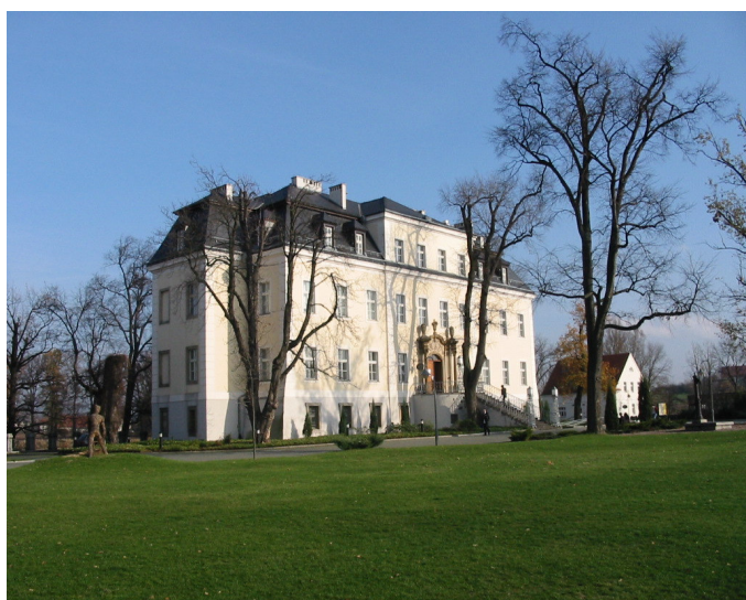
La propriété de Kreisau en Silésie

Le cercle réfléchit aux mesures à prendre pour fonder une nouvelle Allemagne. Il comprend des fonctionnaires, des ecclésiastiques, des officiers ainsi que des politiciens sociaux-démocrates.