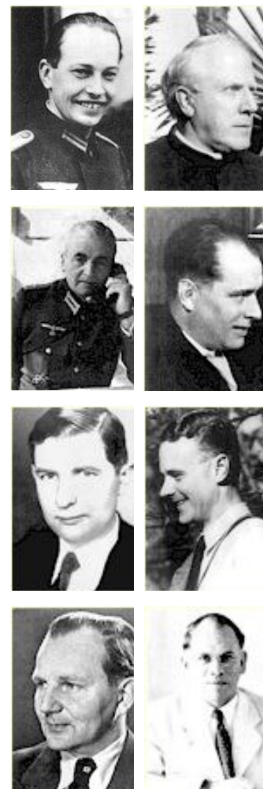
Principaux Membres du Cercle de Kreisau

Les conservateurs voulaient tenter un coup d'Etat sans attentat. Après 1942, beaucoup modifient leurs points de vue et envisagent un renversement du régime et l'élimination de Hitler. De nombreux conservateurs participent au coup d'Etat du 20 Juillet 1944 en association avec des militaires et organisent le futur gouvernement.