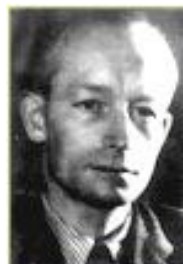
Principaux Membres du Cercle de Kreisau