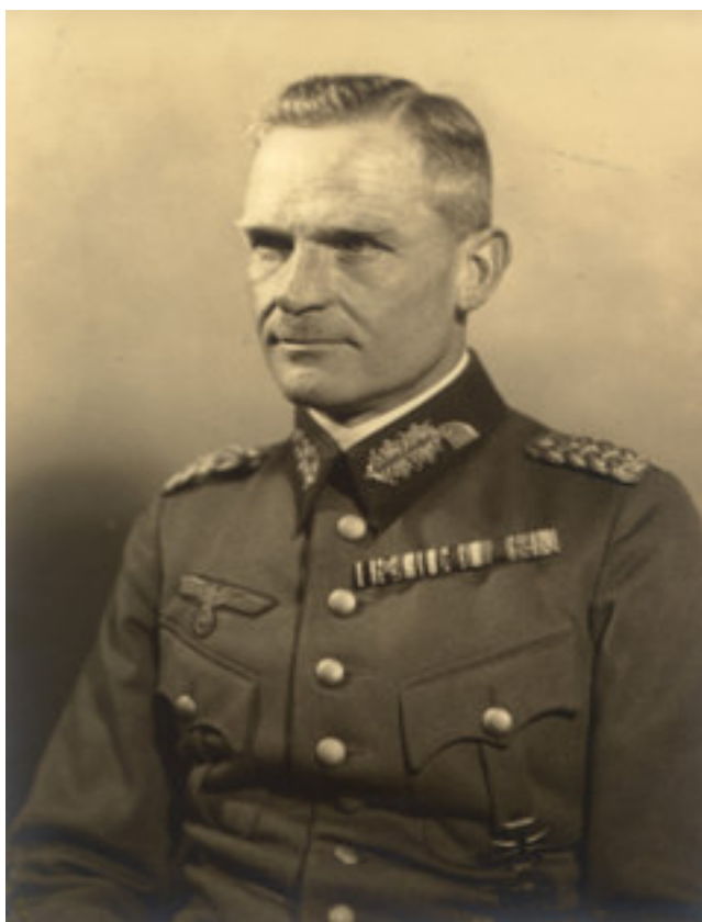
le général von Stülpnagel (1936)